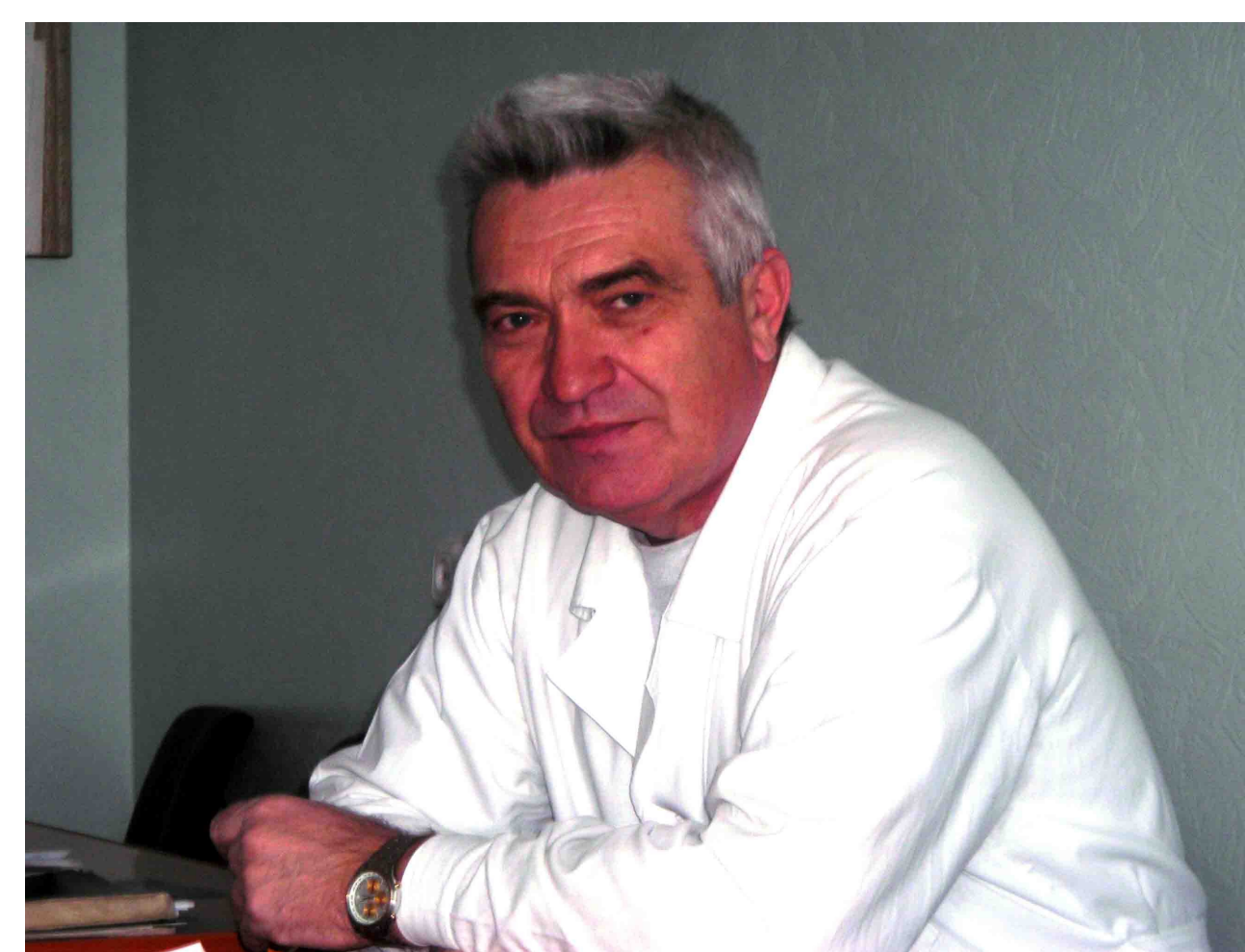
Заслуженный врач РФ, профессор А.И.Проскурин