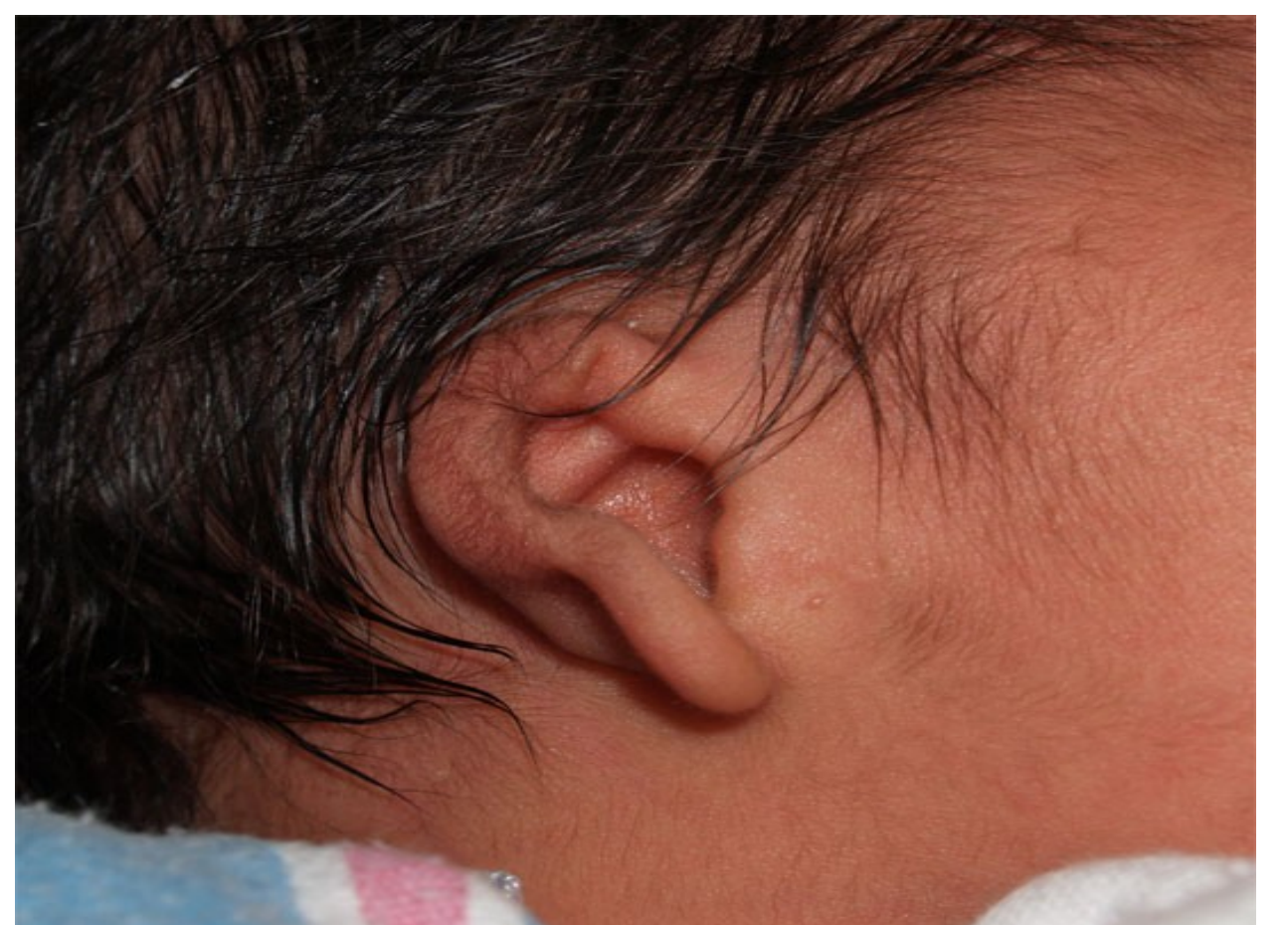
Хирургия пороков наружного, среднего уха и тяжелых форм глухоты: доречевой сенсоневральной тугоухости,