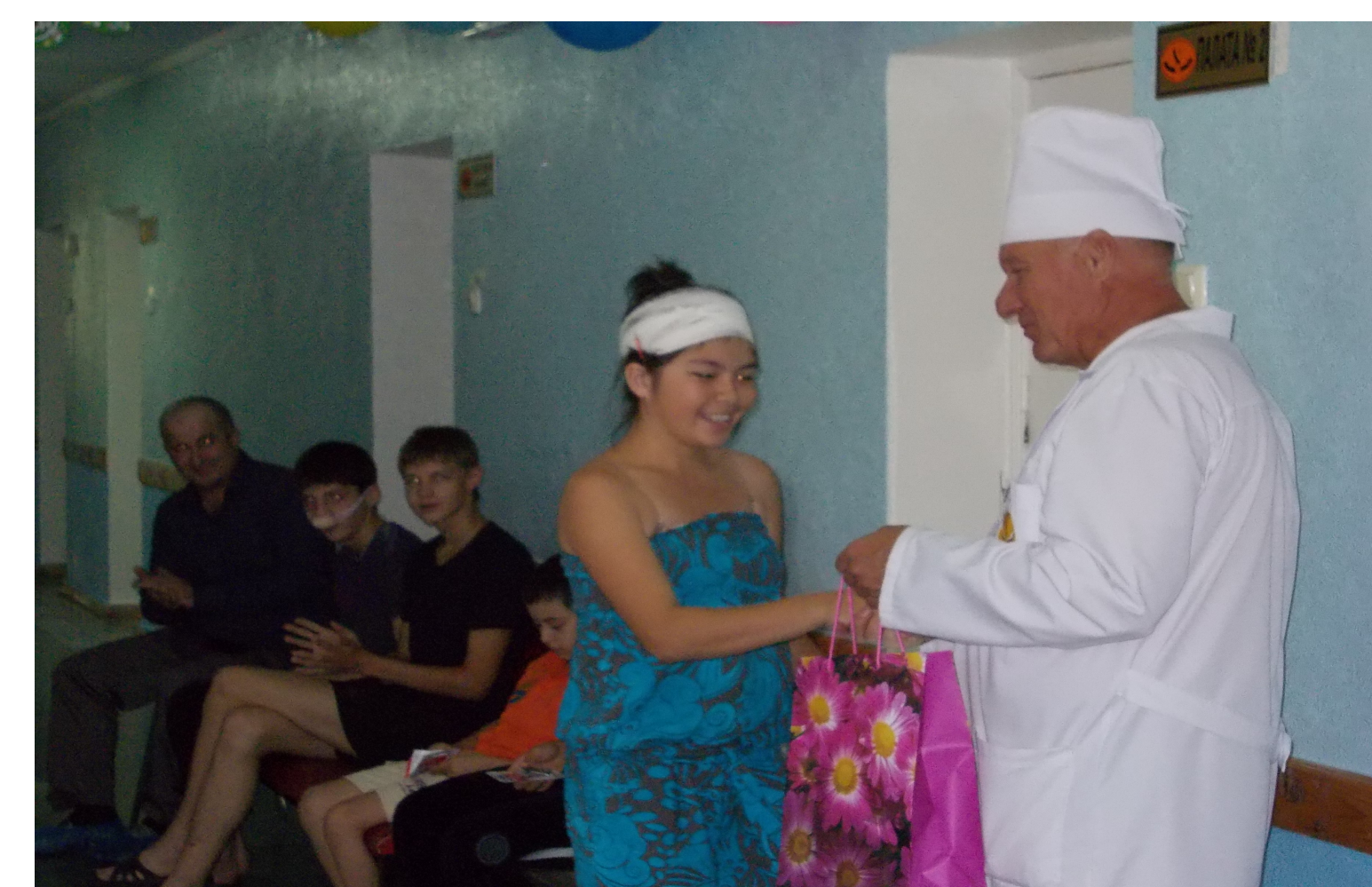
Не только медицина лечит, пациенты клиники встречают праздники с участием своих докторов