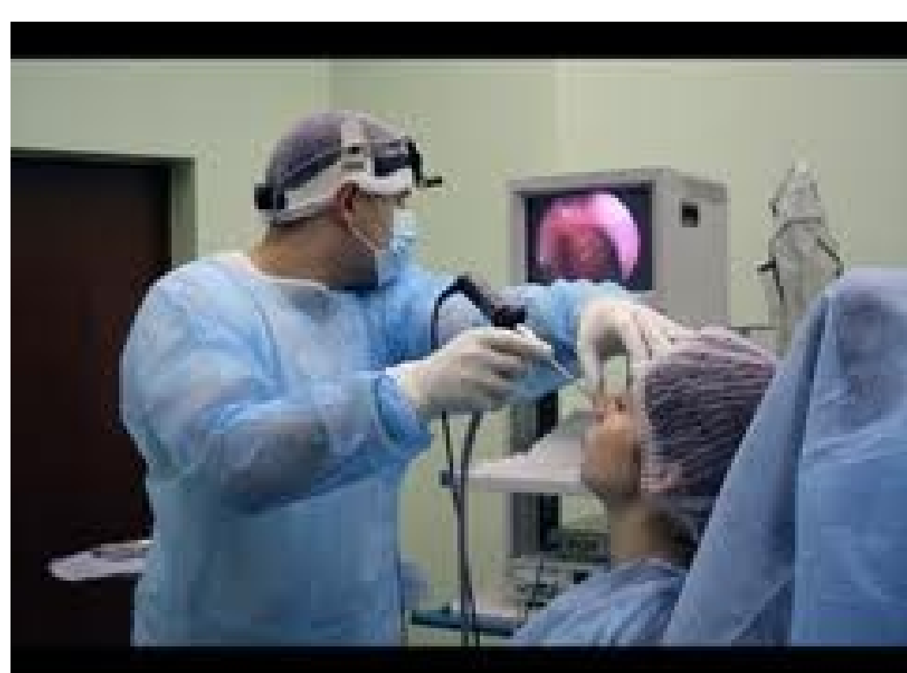
Стандарт обследования пациента нарушенным дыханием — эндоскопическое исследование