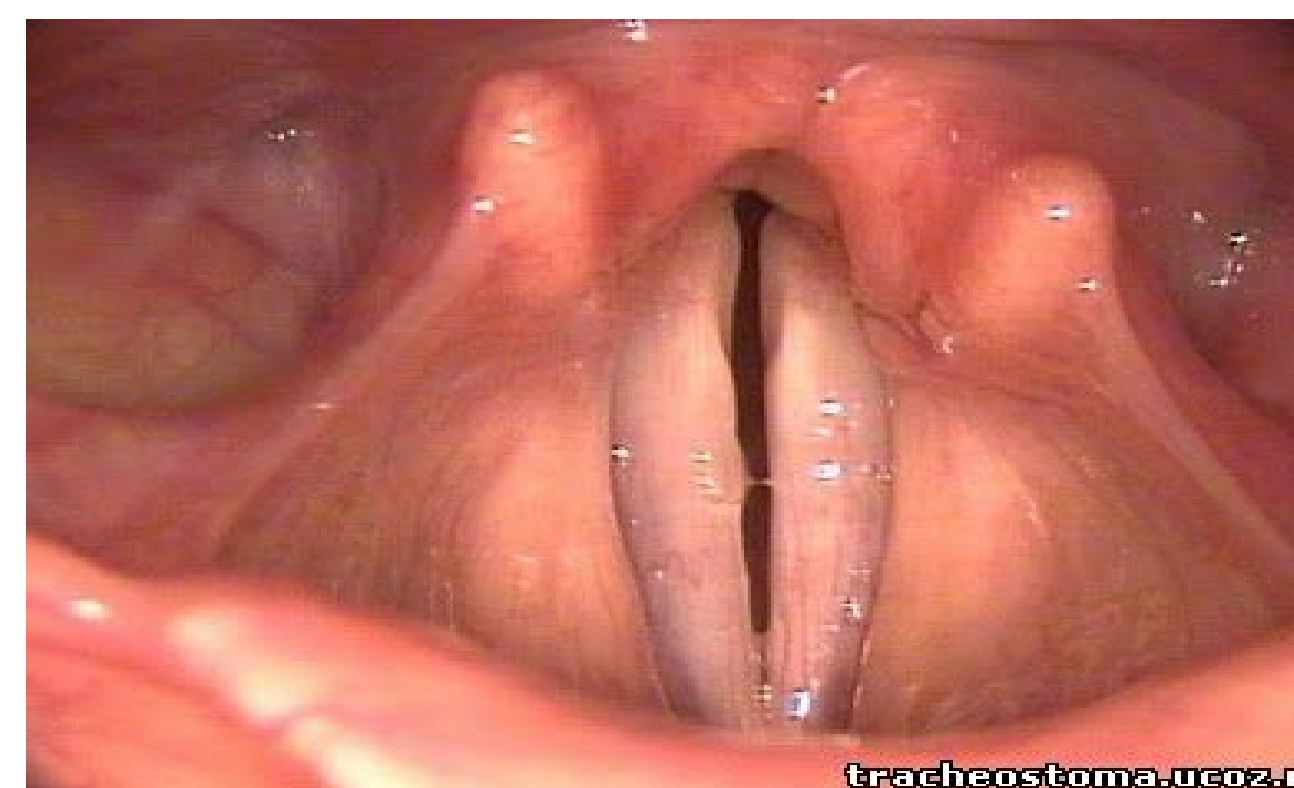
Микроларингоскопия и хирургия параличей гортани