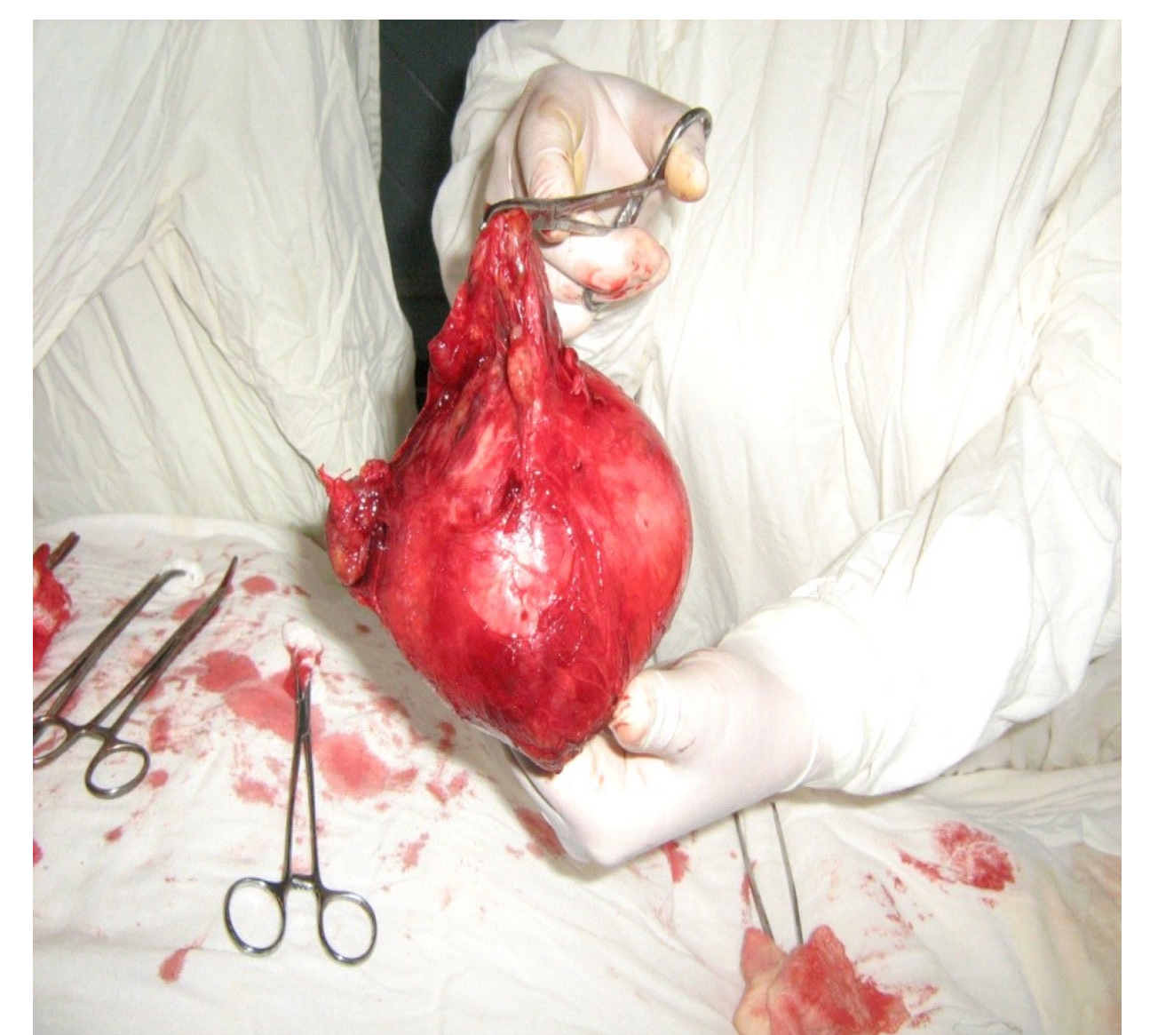
Хирургия компрессионных форм узлового зоба, профилактика охриплости и потери голоса